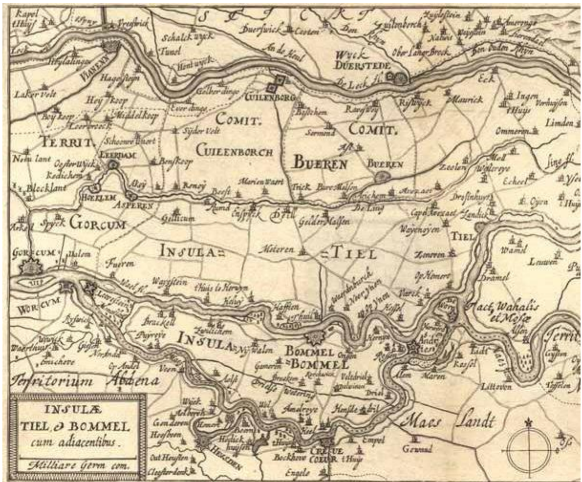
“Insula de Bommel” lugar donde ocurrió.

Guarnecían esta isla 5.000 españoles del Tercio de Holanda, mandados por Francisco de Bobadilla. Cinco mil españoles que, en frase del almirante francés Bonnivet, parecían "cinco mil hombres de armas, y cinco mil caballos ligeros, y cinco mil infantes, y cinco mil gastadores, y cinco mil diablos".