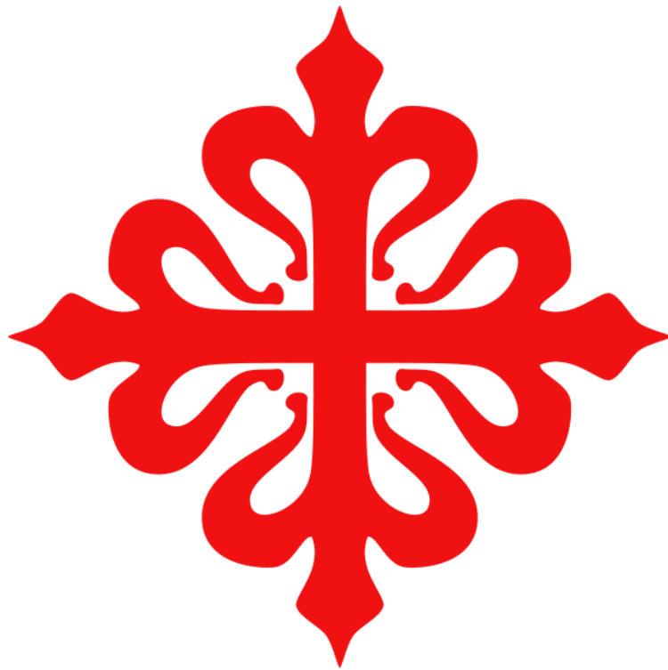
Cruz de la Orden de Calatrava

Los Caballeros de Alcántara hacen el 2 de febrero de 1653 el siguiente juramento y voto: " De común acuerdo, postrados de rodillas, derramando nuestros corazones en afectos tiernos de servir a la Virgen, juramos y votamos sobre los cuatro santo Evangelios y a la Santa Cruz que ahora y siempre asentiremos, afirmaremos, profesaremos y defenderemos que la Virgen Santísima Maria, Madre de Dios y Señora nuestra, en el instante de su animación natural no tuvo mancha de pecado original en su Purísima y candidísima alma; por haber estado prevenida y preservada en el instante que el alma se unió al cuerpo con la gracia habitual santificante que la poderosa mano de Dios Omnipotente le infundió por virtud de los merecimientos de la pasión y muerte de Cristo nuestro Señor. "