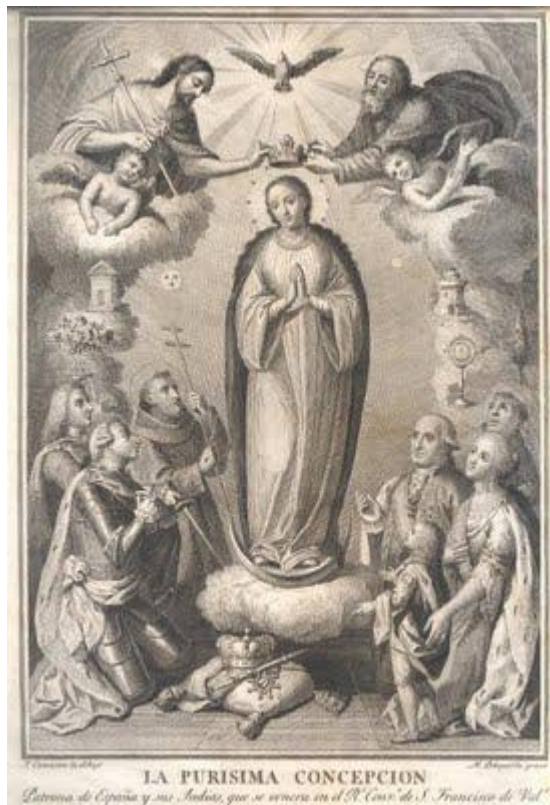
LA PURISIMA CONCEPCION

Letania de España y sus Indias, que se venera en el P. Con. de S. Francisco de Val.