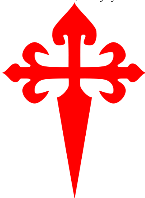
Cruz de la Orden de Santiago

Los Caballeros de Santiago hicieron el año 1650 un voto del tenor siguiente. "Nosotros, Caballeros de la ínclita Orden de Santiago, congregados en la capilla real de nuestro rey Felipe IV, el día 30 de diciembre , dedicado a la Traslación de Santiago, firmamos de nuestro puño y letra esta escritura, en cuya virtud, en nombre de toda la Orden y todos sus Caballeros, religiosos y monjas, deseosos de restaurar la devoción de nuestros mayores a la Inmaculada Concepción de la Virgen Maria, y consagrando nos con nuevos vínculos a su servicio, profesamos, afirmamos y protestamos que la Virgen Madre de Dios, Maria Santísima, en el primer instante de su concepción y animación fué exenta e inmune de toda mácula de pecado original y juntamente redimida con más noble género de redención por los méritos de Cristo, su Hijo y Señor nuestro."