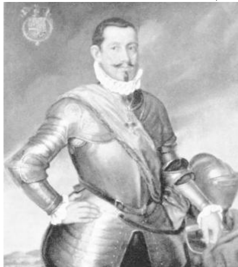
Maestre de Campo Francisco de Bobadilla

El conde de Holac, que mandaba la escuadra Protestante, sitia la isla. El bloqueo se estrecha cada día más. La lucha, continua y cruel, va eliminando poco a poco a los soldados de Bobadilla. Secretamente piden los españoles auxilio a Farnesio y al conde de Mansfield sin resultado práctico. Cuando los pertrechos de guerra y de boca estaban casi agotados, el conde Holac les intima a la rendición, ofreciéndoles grandes ventajas.